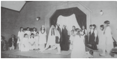
昭和初期の学芸会