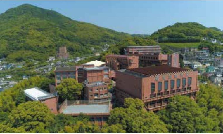
伊良林2丁目の校舎