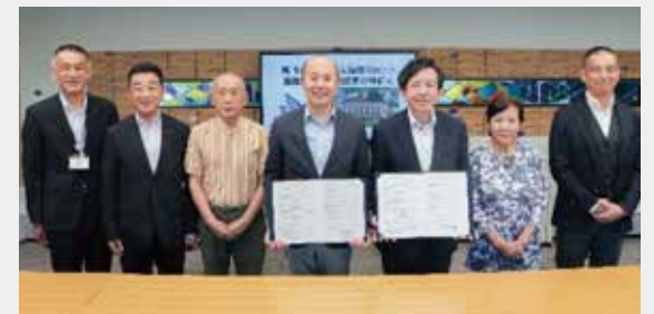
長崎市役所での指定避難所締結式

長崎市で1000人規模を収容できる施設は初めてです。災害時の避難所の開設については、長崎市からの情報をご確認ください。