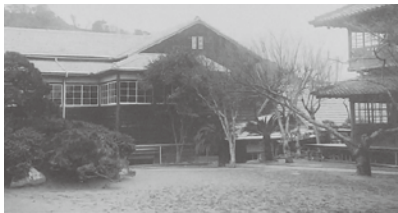
瓊浦高等女学校時代の桜馬場校舎