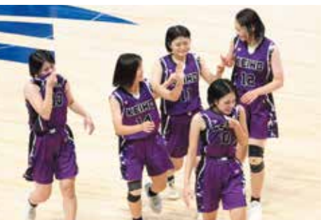
R7ウインターカップ長崎県予選で見事初優勝を決めたバスケットボール部女子