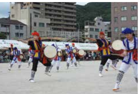
校区祭りでも踊りを披露したエイサー・和太鼓部「瓊琉会」